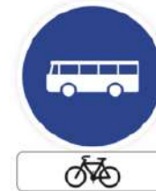
PANONCEAU DE CATÉGORIE CYCLE : VOIE RÉSERVÉE AUX VÉHICULES DE TRANSPORT EN COMMUN ET AUTORISÉE AUX CYCLES