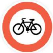
ACCÈS INTERDIT AUX CYCLES