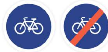
PISTE OU BANDE OBLIGATOIRE POUR LES CYCLES (DÉBUT ET FIN)