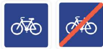
BANDE OU PISTE CYCLABLE CONSEILLÉE ET RÉSERVÉE AUX CYCLES (DÉBUT ET FIN)