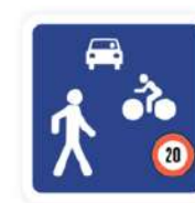
ZONE DE RENCONTRE : PRIORITÉ AUX PIÉTONS ; DOUBLE-SENS CYCLABLE