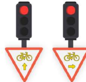
TOUT DROIT OU TOURNE-À-DROITE : AUTORISATION DE DÉPASSER LE FEU ROUGE, EN CÉDANT LE PASSAGE AUX PIÉTONS ET AUX VÉHICULES QUI BÉNÉFICIENT DU FEU VERT