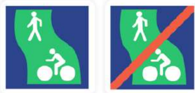
SIGNALISATION D'UNE VOIE VERTE : RÉSERVÉE AUX PIÉTONS, AUX CAVALIERS ET AUX VÉHICULES NON MOTORISÉS (DÉBUT ET FIN)